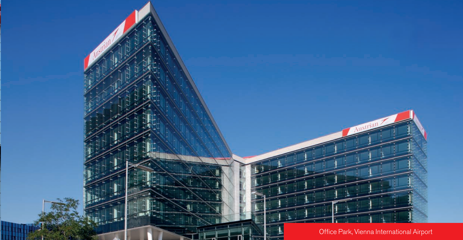
Office Park, Vienna International Airport

Durch den allgemeinen Farbwiedergabe-Index ( r_a ) wird gekennzeichnet, welchen Einfluss die spektrale Transmission auf die Farberkennung von Gegenständen in einem Raum hat, der mit Funktionsisolierverglasung verglast ist. Die Ermittlung erfolgt nach EN 410 bei Berücksichtigung einer Bezugslichtart (Normlichtart D65) gleicher oder ähnlicher Farbtemperatur.