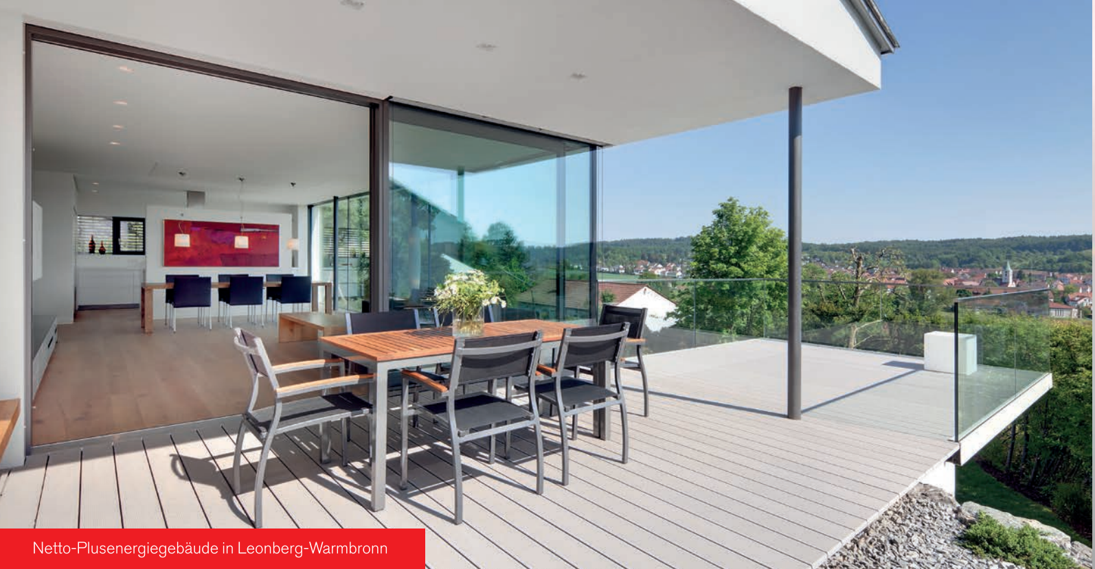
Netto-Plusenergiegebäude in Leonberg-Warmbronn